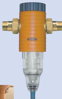
Eurodiago carenato batteriostatico 3/4" - 1 1/4"

I filtri Cillit®-Eurodiago batteriostatici possiedono questa caratteristica unica nel settore per acque ad uso potabile, tecnologico e per l'industria.