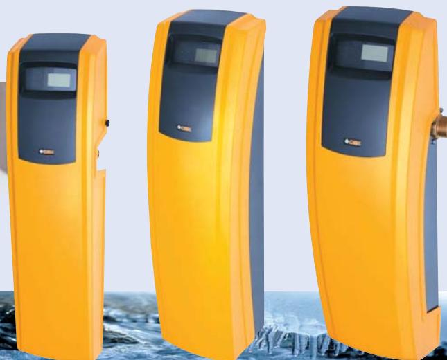
Cillit-AQA Total 4500